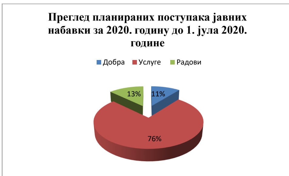
Табела број 8: Графички преглед планираних поступака јавних набавки за 2020. годину до 1. јула 2020. године